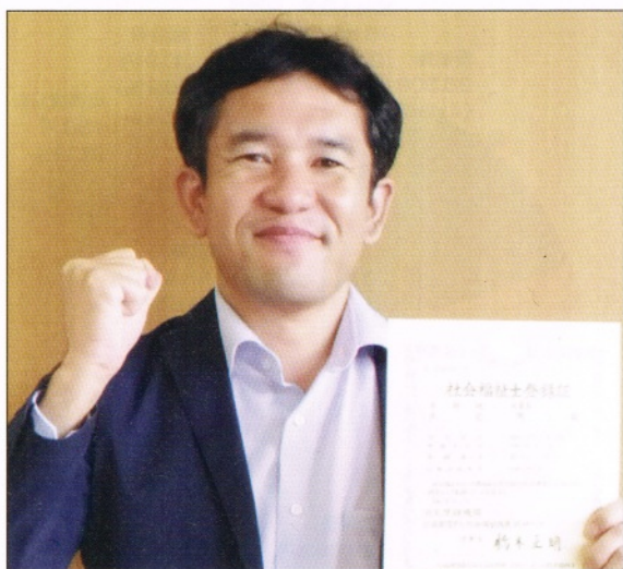
社会福祉士の資格を活用して更なる県政発展に貢献して参ります

議員として活動する中、障害や介護、生活困窮など福祉全般の相談を受けることが多く、より専門的な知識、能力を身につけようと2年前から通信制大学で 議員として活動する中、障害や介護、生活困窮など福祉全般の相談を受けることが多く、より専門的な知識、能力を身につけようと2年前から通信制大学で