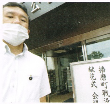
▲播磨町戦没者追悼平和祈念献花式 (8/13)