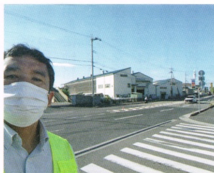
▲秋の全国交通安全運動が行われました