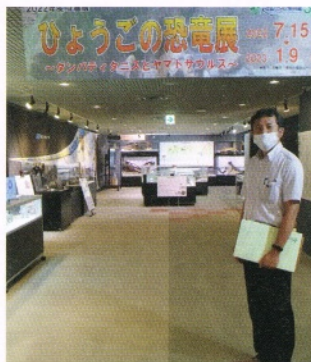
▲今年度は文教常任委員会に所属することとなりました