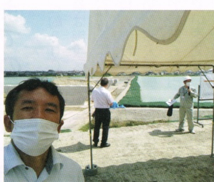
▲県議会で天満大池バイパスを視察 (8/9)