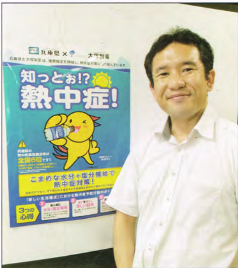
熱中症の予防対策を呼びかけ中です。皆さま、こまめに水分と塩分を補給しましょう！

ご鞭撻をいただきながら、ふるさと加古郡のたの活動に全身全霊を傾ける決意を再確認して、あいさつとさせていただきます。