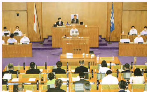
第354回定例県議会緊急経済対策の6月補正予算案を可決しました

コロナ対策では県警戒指標の最高レベルを超える「特別」に専用病院などで1200床程度を確保できる予算を増額。大規模接種会場も2カ所設置（西宮市と姫路市）し、酒類販売事業者の月次支援金では国の対象要件の売り上げ減