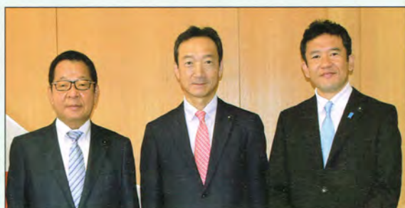
会派の建設副部長にも就任しました