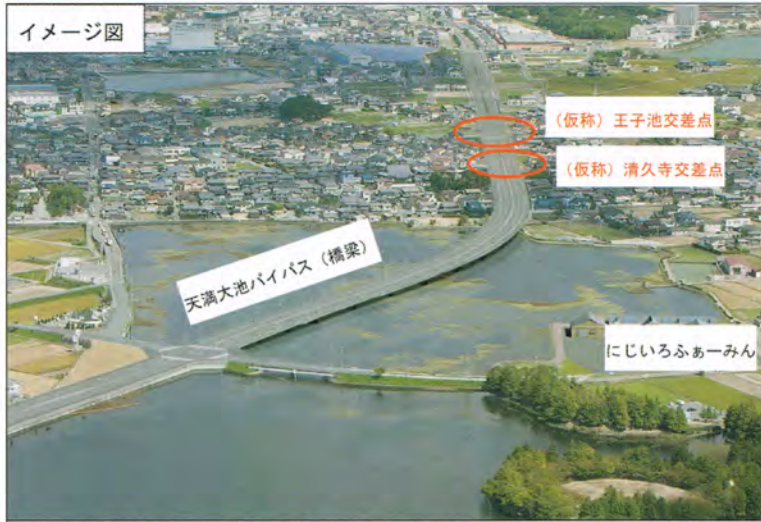
県道宗佐土山線「天満大池バイパス」事業のイメージ図