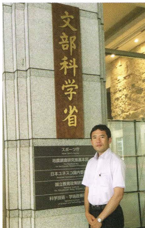
文部科学省を視察しました (7月4日)