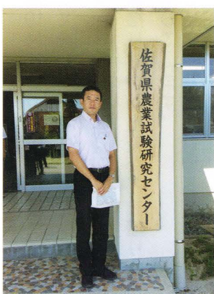
会派で佐賀県農業試験研究センターを視察 (8月23~24日)