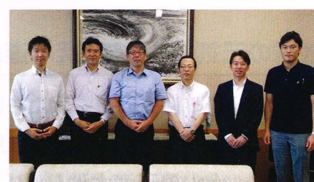
兵庫県東京事務所にて研修会を実施。兵庫県のアンテナショップなどの取り組みを調査しました。