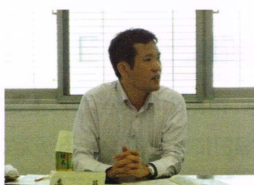
東播の管内視察にて外国人を対象とした観光と、ものづくり(ファボラボ)について意見しました。