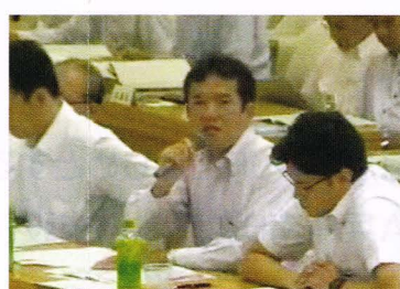
本庁にて地域創生戦略(素案)について土地利用の緩和と行政手続きのスピードアップについて意見しました。(写真はネット中継のもの)